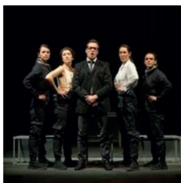
»Astronettes, la longue marche vers les étoiles »

Un théâtre qui rend hommage aux pionnières, à toutes les femmes qui ont ouvert les portes pour les autres héroïnes des temps modernes.